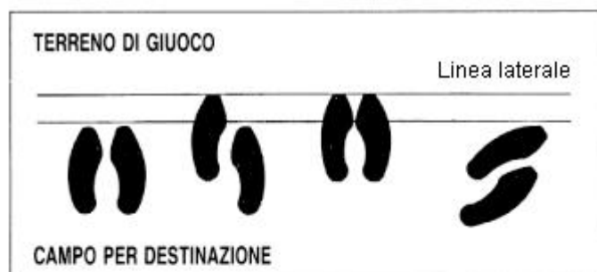
Posizione regolare dei piedi