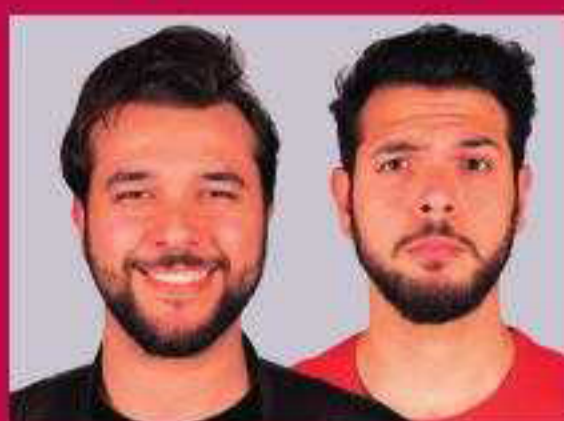
I Sansoni Mal d'Italia