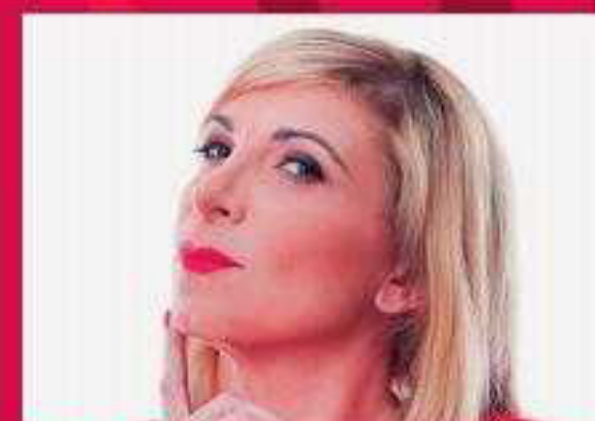
B. Foria Euforia