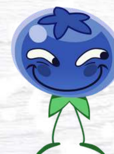
GLUE BARRY IL MIRTILLO APPICCICHINO