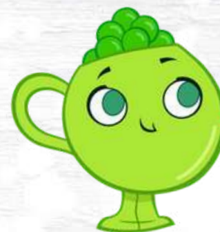
PEA CUP LA TAZZA PISELLINA