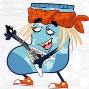
SOCK STAR IL CALZINO SUPERSTAR