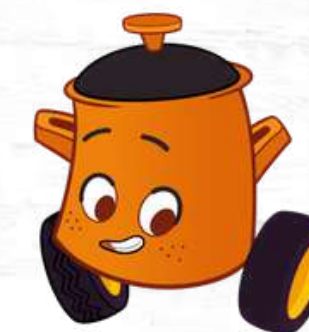
PARKING POT IL PENTOLINO PARCHEGGINO