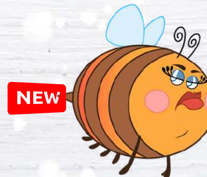
FUMBLE BEE L'APE PESTIFERA