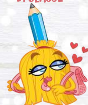
CLASS BROOM LA SCOPETTA DI CLASSE