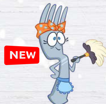
HOME FORK LA FORCHETTA CASALINGA