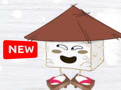
RICE CUBE IL CUBETTO DI RISO