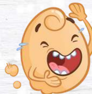
EGG SMELL L'OVETTO PUZZOSO