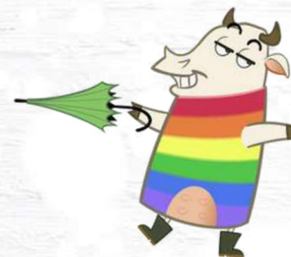
RAIN COW LA MUCCA DA PIOGGIA