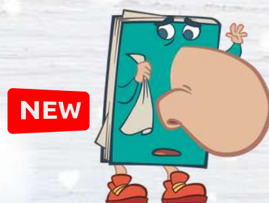
NOISE BOOK IL QUADERNO NASONE