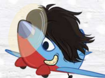
HAIR PLAN L'AEREO CAPELLONE