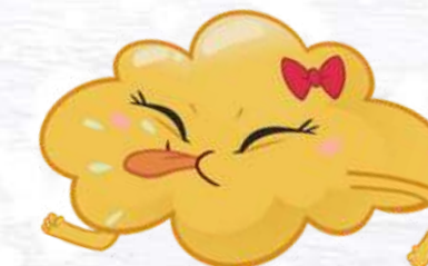
LEMON FART LA PUZZETTA AL LIMONE