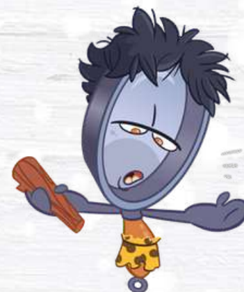
CAVE PAN IL PADELLONE PREISTORICO